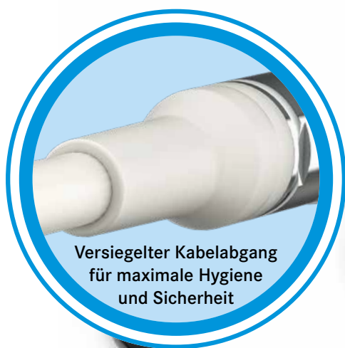
Versiegelter Kabelabgang für maximale Hygiene und Sicherheit